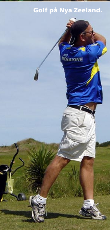
Golf på Nya Zeeland.