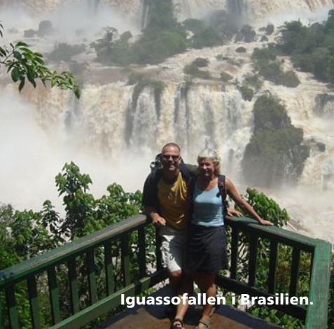
Iguassofallen i Brasilien.